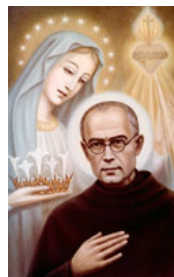
St Maximilien Kolbe Pologne