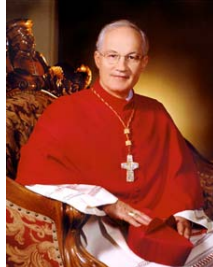
S. Ém. le Cardinal Marc Ouellet Québec QC