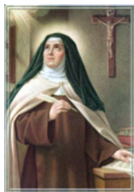
Sainte Thérèse d'Avila Espagne