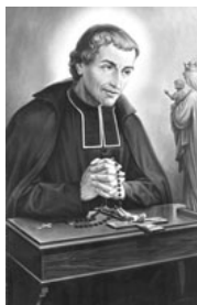
St Louis-Marie de Montfort France