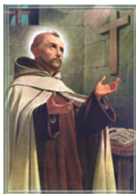
Saint Jean de la Croix Espagne

La Note doctrinale des évêques de 2001 le reconnaît elle-même : « L'Église catholique a toujours admis la possibilité de révélations privées, à la faveur de visions et d'expériences auditives. En fait, la tradition et la pratique de l'Église, dans plusieurs de ses dévotions, ses prophètes et mystiques reconnus, tels que saint Jean de la Croix et sainte Thérèse d'Avila, présupposent l'existence de révélations privées authentiques. »