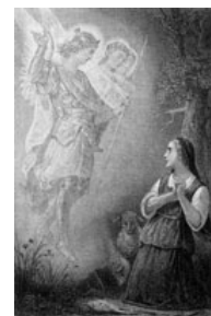
Ste Jeanne d'Arc France

Si saint Jean de la Croix, sainte Thérèse d'Avila, saint Louis-Marie Grignion de Montfort, saint Jean Bosco, saint Maximilien Kolbe, saint Pio de Pietrelcina et tant d'autres saints ou fondateurs, dont la plupart furent persécutés par leurs évêques, leurs supérieurs ou leurs confrères (excommuniés, interdits, emprisonnés, traités de fous, sans parler de sainte Jeanne d'Arc qui fut brûlée vive), avaient attendu la reconnaissance de leurs « révélations privées » pour commencer à agir, où en seraient leurs œuvres ?