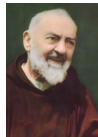
Saint Pio de Pietrelcina Italie

Si saint Jean de la Croix, sainte Thérèse d'Avila, saint Louis-Marie Grignion de Montfort, saint Jean Bosco, saint Maximilien Kolbe, saint Pio de Pietrelcina et tant d'autres saints ou fondateurs, dont la plupart furent persécutés par leurs évêques, leurs supérieurs ou leurs confrères (excommuniés, interdits, emprisonnés, traités de fous, sans parler de sainte Jeanne d'Arc qui fut brûlée vive), avaient attendu la reconnaissance de leurs « révélations privées » pour commencer à agir, où en seraient leurs œuvres ?