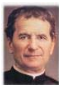
Saint Jean Bosco Italie